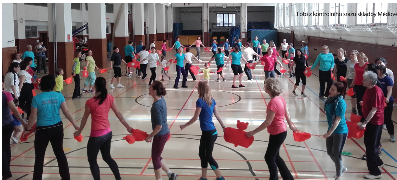
Foto z kontrolního srazu skladby Mědové